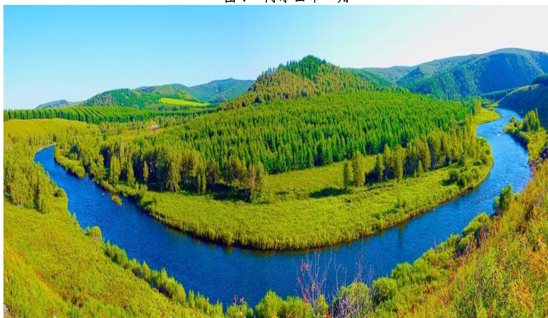
图8 阿尔山市哈拉哈河的夏日美景

“十四五”时期，是阿尔山市开启社会主义现代化新征程的第一个规划期，是生态文明建设和推动绿色高质量发展的关键期。以习近平新时代中国特色社会主义思想为指导，科学编制和有效实施“十四五”规划，在全面建成小康社会基础上，探索以生态优先、绿色发展为导向的高质量发展新路子，建成“绿水青山就是金山银山”的实践