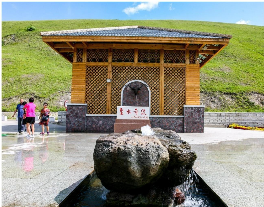
图 12 阿尔山市旅游度假区温泉之一