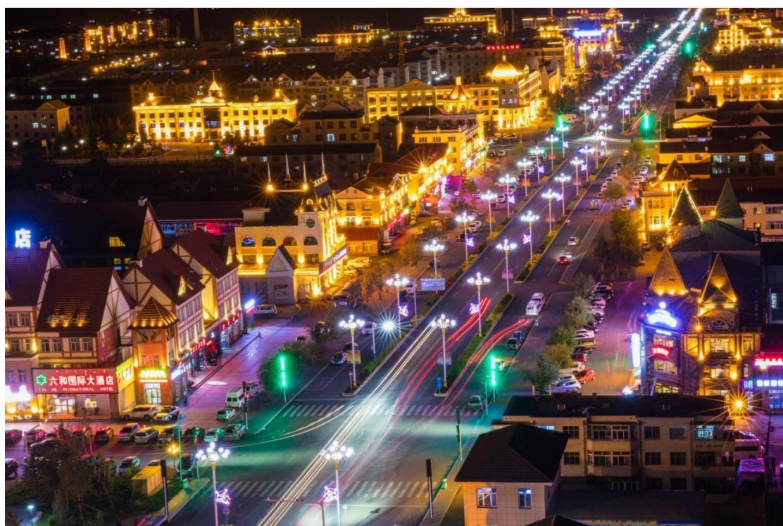
图10 阿尔山市旅游度假区街景（二）