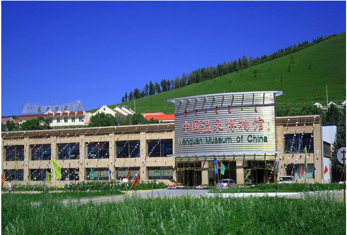
图 13 阿尔山市旅游度假区温泉博物馆