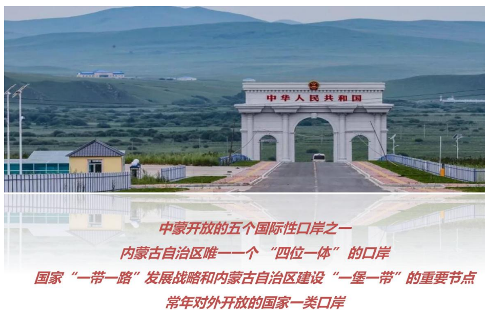
图 4 阿尔山市阿尔山口岸景区

坚持生态文化旅游口岸的定位，从 2020 年开始，阿尔山全力打造国门界河桥观光通道、口岸旅游环线和门山景区“空中生态廊桥”等在内的口岸界河自然风景区。