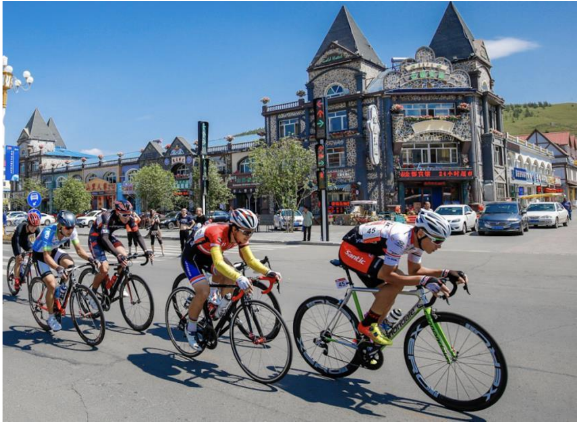
图 11 阿尔山市旅游度假区街景（三）