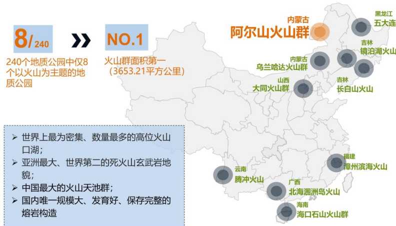
图2 阿尔山市火山地貌分布图

阿尔山火山群拥有世界上最为密集、数量最多的高位火山口湖， 具有世界级科考教学价值及观赏价值