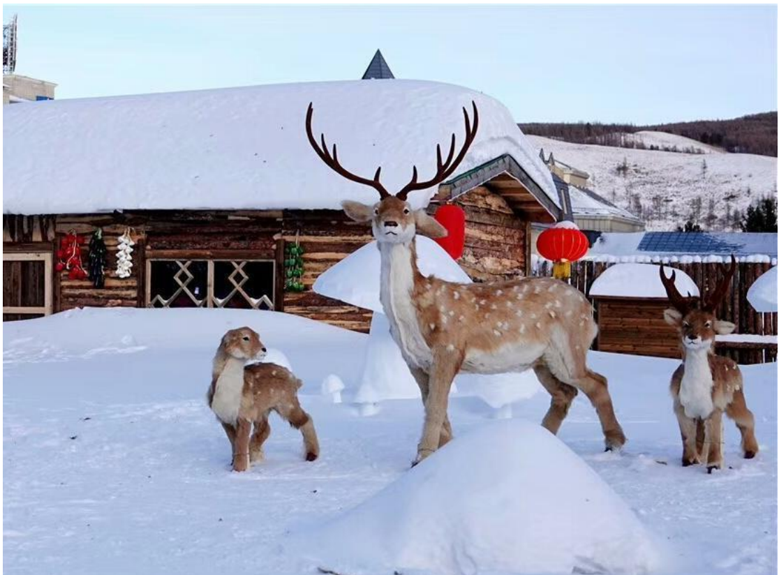
图 14 阿尔山市旅游度假区雪村冰雪神韵