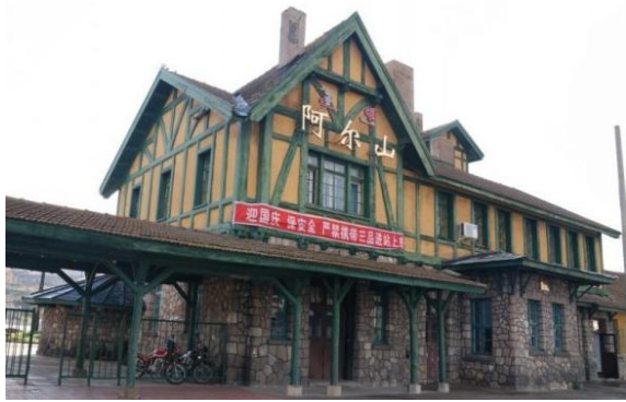
图 1 阿尔山市旅游度假区自然和人文景观图

阿尔山市先后获得国家 5A 级旅游景区、世界地质公园、“城市双修”试点城市、“一带一路”国际健康旅游目的地、中国十佳温泉小镇、中国气候生态市、中国最美县域、国家生态文明建设示范市、中国避暑旅游十佳城市、中国天然氧吧、“绿水青山就是金山银山”实践创新基地等称号。