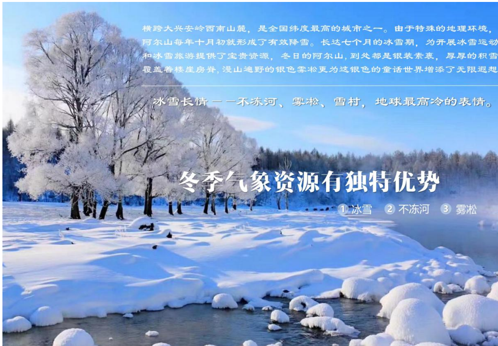
图6 阿尔山市冬季气象资源