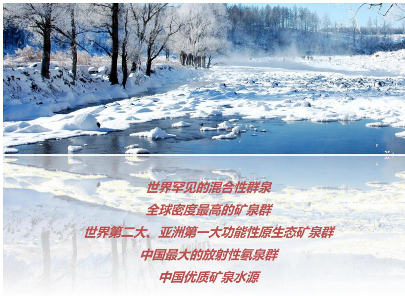
图3 阿尔山市矿泉被誉为“神泉圣水”

阿尔山地处内蒙古及东北地区的地热资源富集区，阿尔山温泉以其神奇的治疗和保健功效享誉国内外；距城区 2.5 公里的五里泉矿泉水，被原地矿部、卫生部和轻工部联合鉴定为低矿化度、低钠、偏硅酸、重碳酸钠型优质矿泉水，辖区内分布着四个矿泉群，经专家初步查明的矿泉有 76 眼之多，小的不计其数，阿尔山市旅游度假区拥有的中国温泉博物馆属于国家 AAAA 级景区。